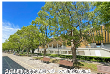
大井ふ頭中央海浜公園スポーツの森(約3390m)