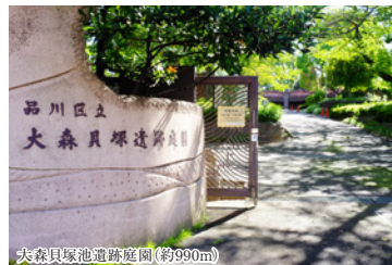
大森貝塚遺跡庭園(約990m)